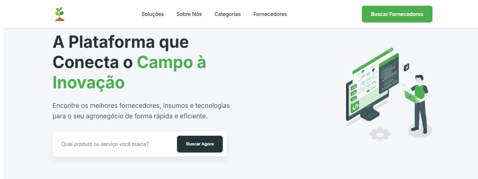
Figura 1. Página inicial do site.

O projeto propõe uma solução digital que disponibiliza preços confiáveis de produtos agrícolas para pequenos produtores rurais. A iniciativa reduz a desinformação ao oferecer dados claros e atualizados de mercado, apoiando decisões de compra e venda. Ao ampliar a transparência e facilitar o acesso a informações locais, o projeto fortalece a autonomia e a competitividade do produtor no campo.