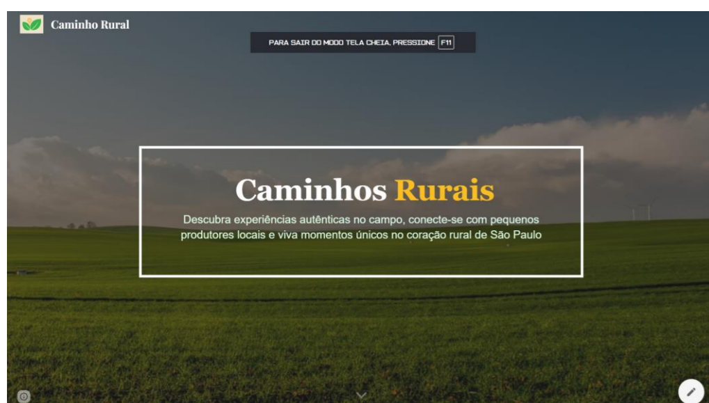
Figura 1. Capa do site

O Caminhos Rurais é um projeto criado para valorizar o turismo rural e promover a conexão entre pessoas, natureza e cultura. A iniciativa incentiva o desenvolvimento sustentável das comunidades rurais, aproximando visitantes de experiências autênticas no campo. O site funciona como uma plataforma de roteiros rurais, reunindo em um só espaço informações sobre propriedades, atividades e produtos locais. Os usuários podem explorar rotas, conhecer histórias de produtores, ver fotos e planejar experiências diretamente pelo portal. Com um design simples e intuitivo, o projeto prioriza a facilidade de navegação e cores que remetem à natureza. Além de divulgar o turismo, o Caminhos Rurais fortalece a economia local, valorizando agricultores, artesãos e empreendedores do interior. Mais do que um site, o projeto é um convite para vivenciar o campo, descobrir novos destinos e reconhecer o valor da vida rural, unindo tecnologia e tradição para mostrar que o futuro do turismo também floresce no interior.