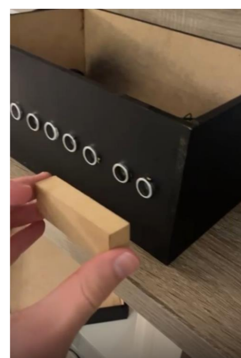
Figura 2. Objeto no sensor.

Os resultados obtidos confirmaram que o SmartVaga atende aos objetivos propostos. O sistema identificou corretamente a presença e ausência de veículos em todas as simulações. O Arduino passou todos os dados para o computador, que foram colocados no Excel funcionou de forma estável, exibindo as alterações em tempo real.