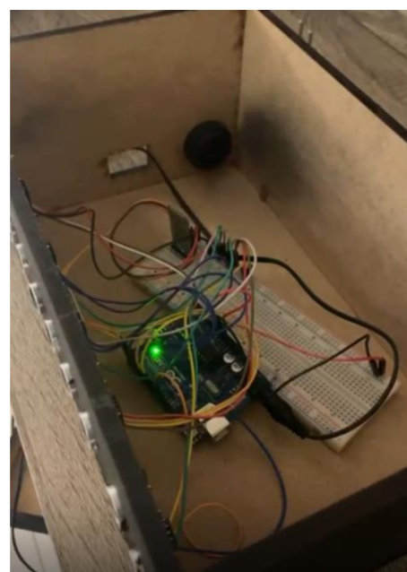
Figura 1. Protótipo

A Internet das Coisas (IoT) vem tornando cidades mais inteligentes. Nesse cenário, o projeto SmartVaga oferece uma solução acessível para gerenciar vagas de estacionamento em campus universitário. O sistema detecta e informa em tempo real a disponibilidade das vagas, permitindo que usuários localizem espaços livres rapidamente, reduzindo congestionamentos. Sensores são fundamentais para coletar dados e otimizar o uso dos espaços urbanos, melhorando a experiência dos motoristas.