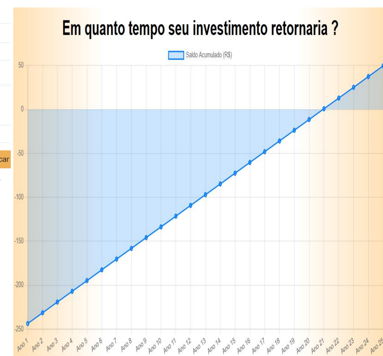
Figura 3. Retorno do investimento.