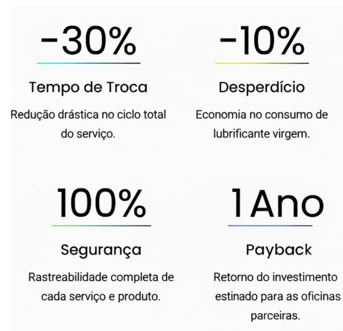
Figura 2. Resultados esperados.

O projeto avançou com a integração dos componentes e definição da lógica de controle, demonstrando viabilidade técnica do sistema. As análises preliminares indicam que a bomba, sensores e HMI atendem às necessidades de automação da troca de lubrificante, garantindo precisão e operação intuitiva. A configuração atual mostra potencial para padronizar o processo, reduzir erros e melhorar o acompanhamento do serviço, reforçando a aplicabilidade da solução em ambientes automotivos.