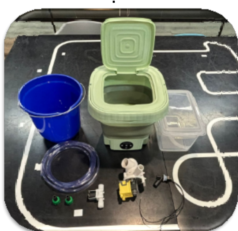
Figura 1. Componentes do Protótipo

O projeto propõe um sistema automatizado para o reuso de águas cinzas das lavagens de roupas, utilizando reservatório, filtragem e sensores de controle. A iniciativa visa reduzir o consumo de água potável, gerar economia e incentivar práticas sustentáveis.