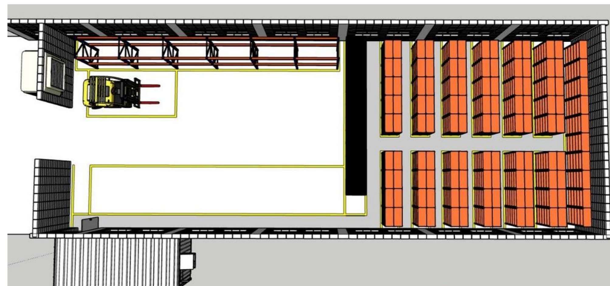
Figura 3. Layout proposto.

Os resultados obtidos com a implementação do novo layout de armazenagem demonstram que os objetivos específicos do projeto foram amplamente atendidos. A reorganização do espaço físico possibilitou um aproveitamento mais eficiente dos 260 m² disponíveis, aumentando a capacidade de armazenagem em até 30% sem comprometer a circulação e a segurança. Paralelamente, benefícios intangíveis também foram percebidos, como o aumento da segurança no ambiente de trabalho, a melhoria da comunicação entre os setores e o fortalecimento da imagem institucional.