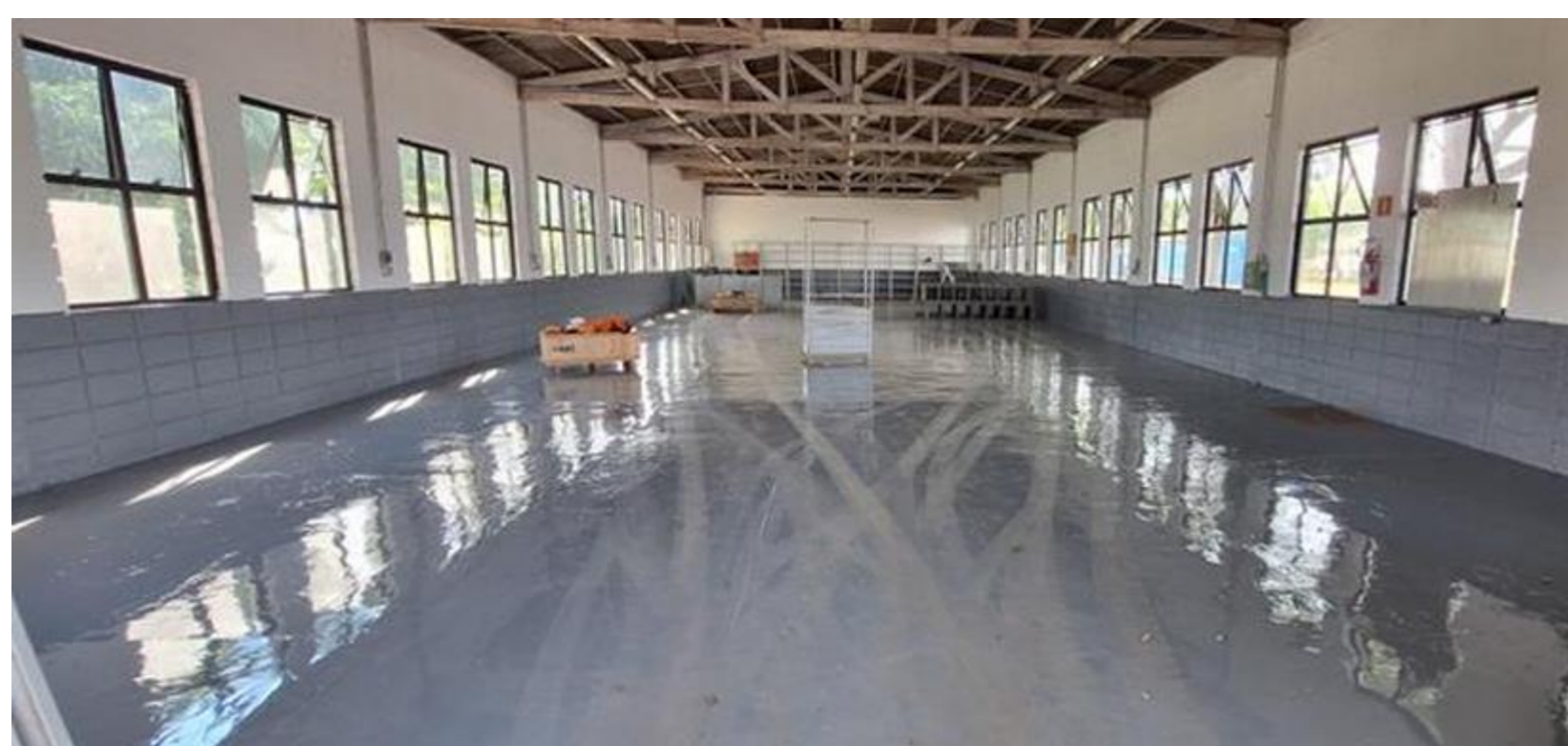
Figura 1. Galpão vazio

A organização física de um almoxarifado é um fator crítico para a eficiência operacional, impactando diretamente o tempo de localização de itens, a segurança, o controle de estoque e, conseqüentemente, a produtividade geral de uma empresa.