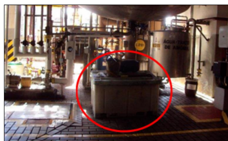
Figura 1. Antes