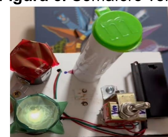
Figura 3. Semáforo verde