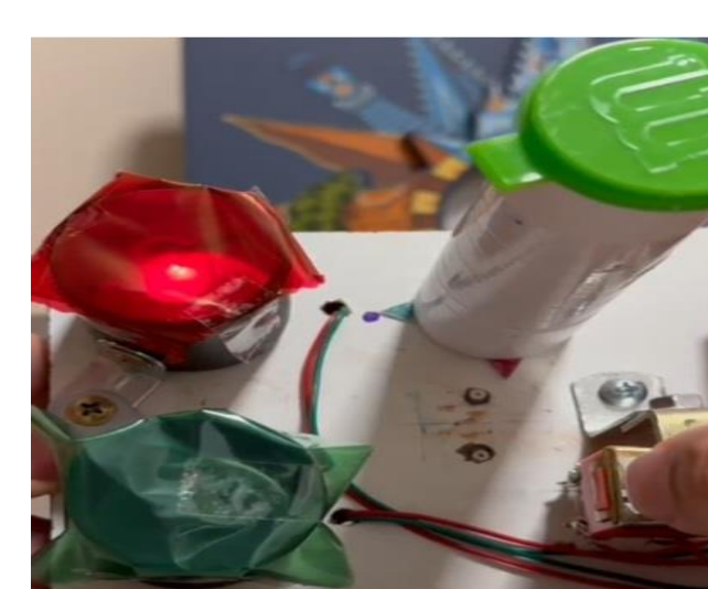
Figura 2. Semáforo vermelho

Durante os testes realizados com simulação assistida por inteligência artificial, a roleta sincronizada funcionou corretamente em 97% dos ciclos do semáforo, girando e sinalizando conforme a mudança de cor (verde/vermelho) para os veículos. O dispositivo foi utilizado por oito pedestres com deficiência visual em um cenário simulado e todos conseguiram identificar corretamente o momento seguro para atravessar, sem necessidade de auxílio externo. Foram registrados dois casos de atraso na rotação da roleta em cerca de 2 a 3 segundos após a troca do sinal, o que indica a necessidade de pequenos ajustes técnicos.