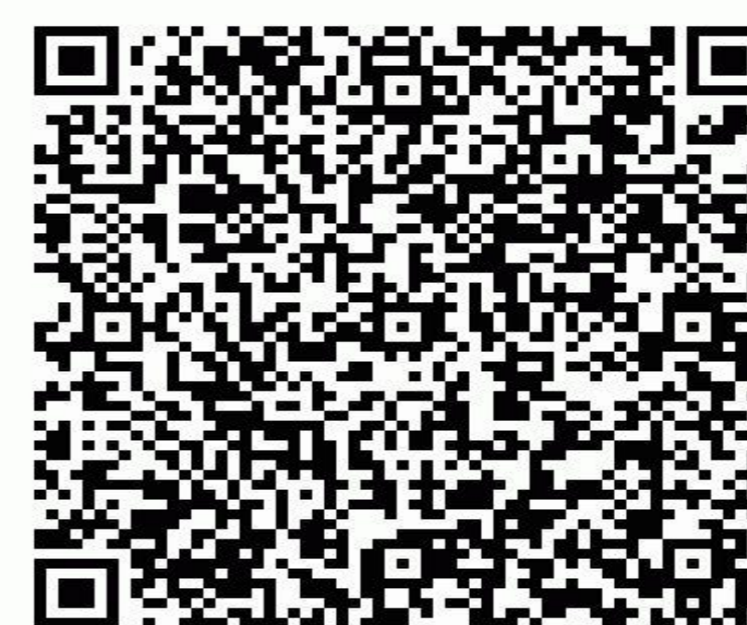
Figura 4. QRCode Aplicativo.