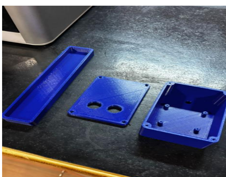
Figura 1. Caixas

O sensor funciona por aproximação, assim que o motorista tentar estacionar seu carro, de acordo com a distancia preveleida entre o carro e o sensor sinalizando com suas cores, podendo ser amarelo e vermelho.