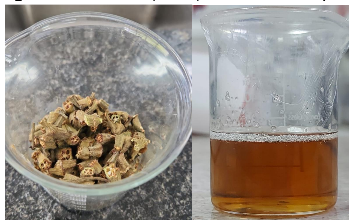
Figura 1. Quiabo (seco) e extrato do quiabo

A rápida industrialização aumenta a geração de efluentes com alta carga de sólidos em suspensão. Coagulantes químicos convencionais, como o sulfato de alumínio, geram lodos tóxicos contendo metais pesados. O uso de coagulantes naturais, como o extrato de quiabo, surge como alternativa biodegradável, de menor custo e baixa toxicidade, podendo substituir coagulantes sintéticos em estações de tratamento simplificadas.