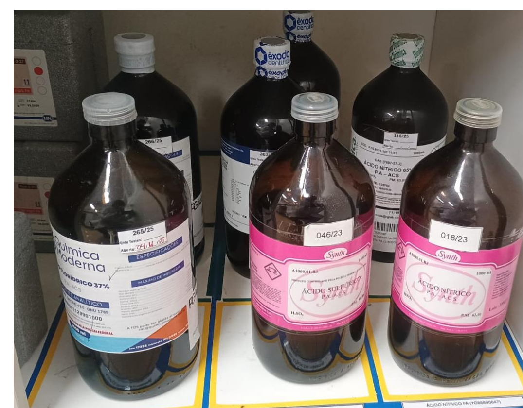
Figura 2. Condição final do armazenamento antes da implementação do FIFO

A aplicação do FIFO e do 5S melhorou a organização, eliminou perdas por vencimento e aumentou a rotatividade do estoque. O giro passou de 2,1 para 4,8 ciclos/ano e a idade média reduziu de 175 para 75 dias. O checklist mostrou evolução de “não conforme” para “conforme”, confirmando a eficácia das melhorias implementadas.