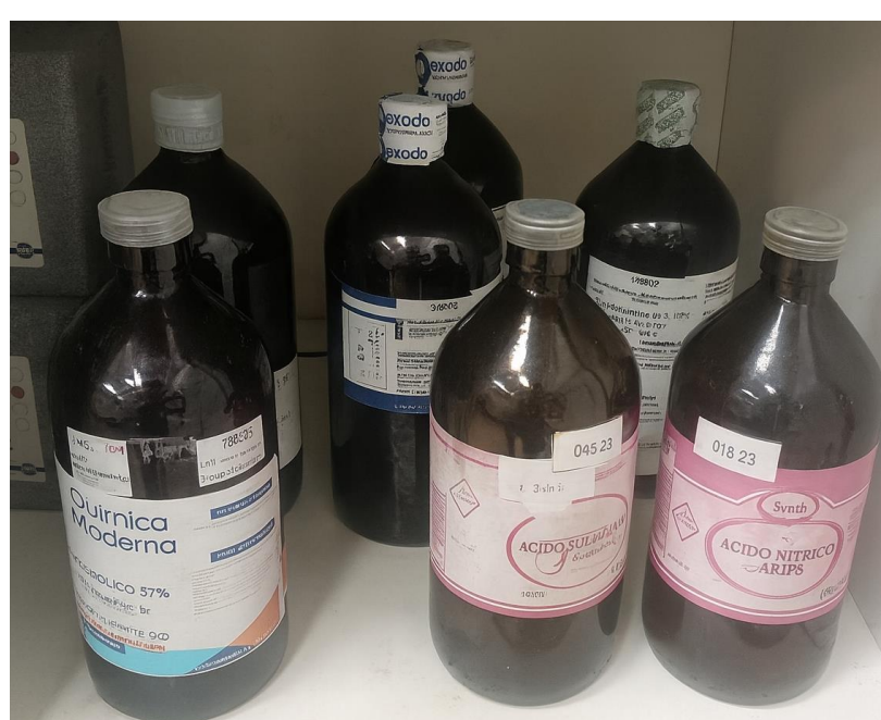
Figura 1. Condição inicial do armazenamento antes da implementação do FIFO

A falta de organização e padronização dos estoques laboratoriais pode gerar vencimentos, desperdícios, retrabalhos e imobilização financeira. Métodos como FIFO e 5S contribuem para maior controle, segurança e eficiência. Este projeto teve como propósito implementar o FIFO aliado ao 5S para melhorar a organização, reduzir perdas e aumentar a rastreabilidade dos insumos do laboratório.