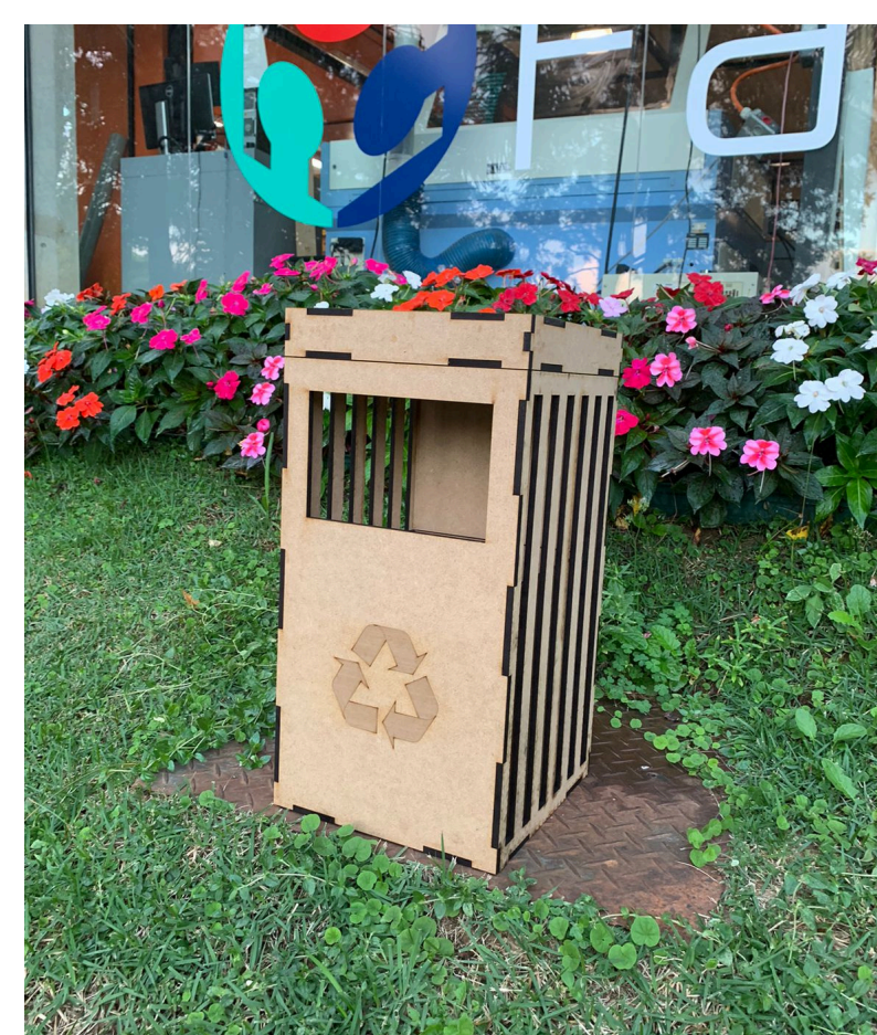
Figura 1 e 2 - Protótipo da lixeira

Os objetivos esperados pelo grupo foram alcançados. A lixeira inteligente detecta o nível interno de resíduos e envia esses dados para uma central de monitoramento informando o nível de enchimento de forma rápida e eficiente, o que coopera para uma gestão organizada e para um desenvolvimento mais sustentável e inteligente.