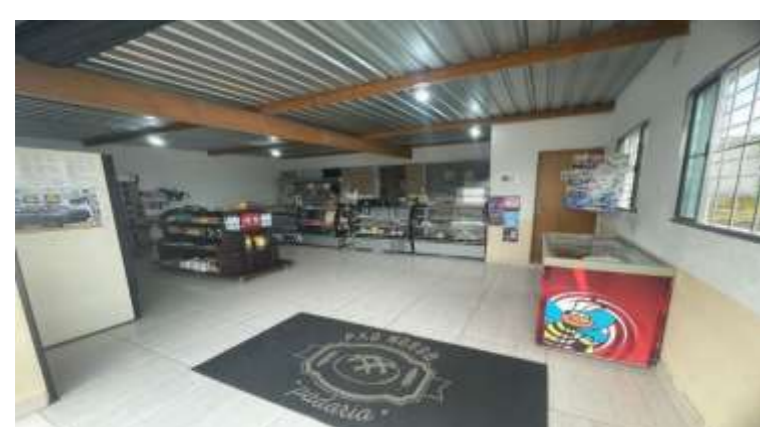
Figura 1. Autoria própria Fonte: Elaborado pelos autores.

O layout de uma padaria não se resume apenas à disposição de móveis e produtos. Ele é a alma do ambiente, influenciando diretamente a experiência dos clientes, o fluxo de vendas e a organização do negócio. E, também, tem os diversos problemas que a padaria enfrentava com a falta de um layout, como, o problema no recebimento e falta de organização dos produtos. Assim, a alteração de layout para a padaria Nosso Pão foi dinamizada para atender as necessidades do dia a dia. Ademais, organizar o espaço trará mais clientes e vendas.