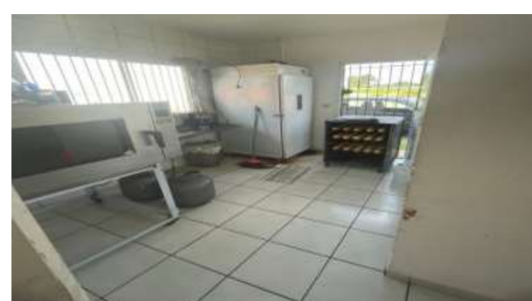
Figura 2. Autoria própria Fonte: Elaborado pelos autores.