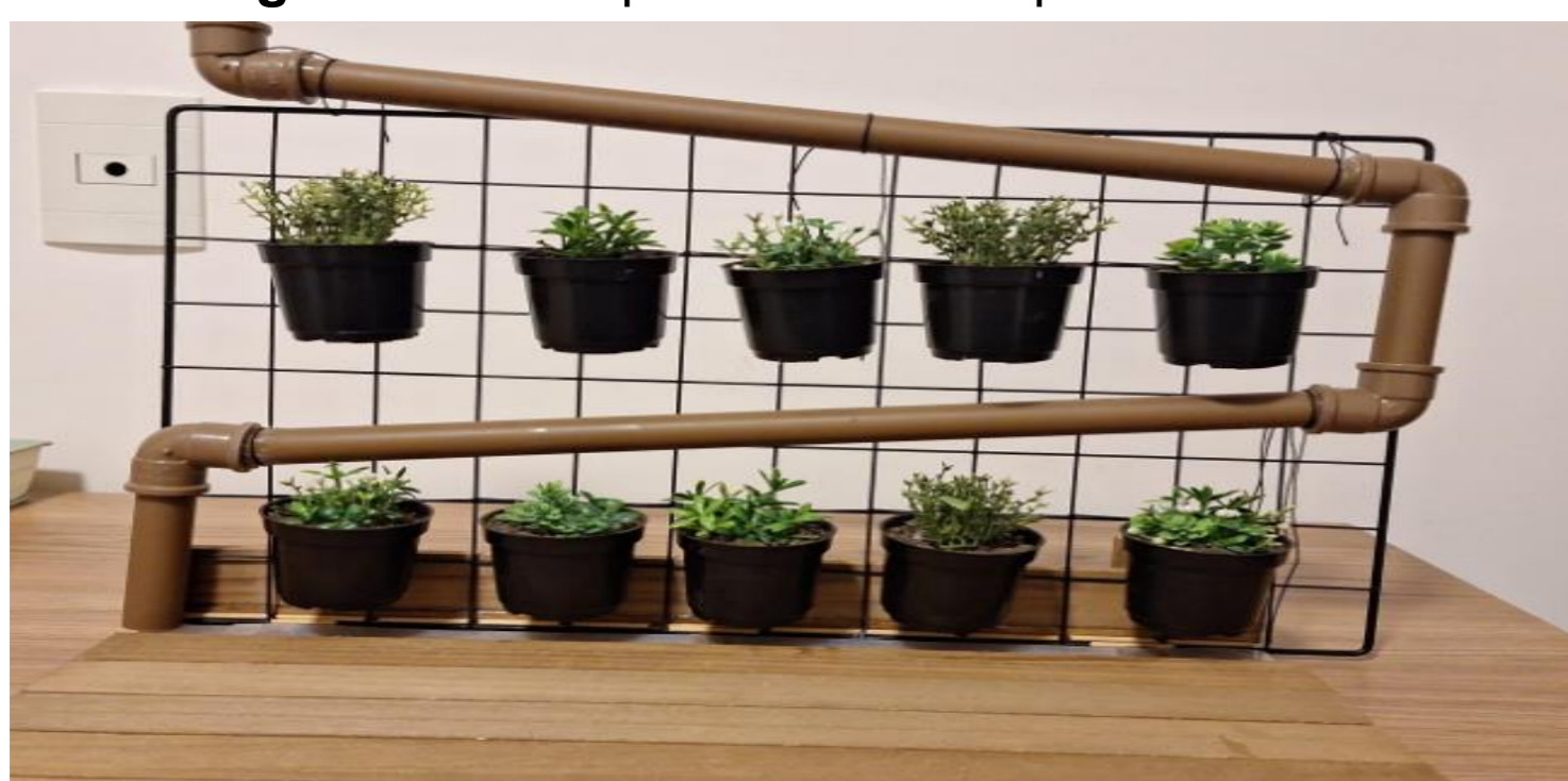
Figura 1. Protótipo ilustrativo do painel

Este projeto visa implementar um sistema de plantio vertical em uma comunidade em situação de vulnerabilidade. O projeto busca fomentar o manejo estrutural e a colheita incentivando tanto o consumo próprio quanto a geração de renda por meio da comercialização. Mais do que alimentos, o projeto oferece conhecimento, protagonismo e novas perspectivas.